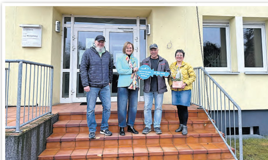
Das Ärztehaus in Passow wurde symbolisch übergeben.

Neben den bereits fertiggestellten Baumaßnahmen wurde noch ein Halt bei der aktuell laufenden Baumaßnahme am Bahnhofsvorplatz gemacht. Der Vorplatz am Bahnhof Passow wird derzeit neu gestaltet und gewinnt nach Bauabschluss deutlich an Aufenthaltsqualität. Dazu gehört der barrierefreie Ausbau der Bushaltestelle sowie der Neubau von Park-and-Ride- und Bike-and-Ride-Anlagen. Baubeginn war Ende November 2025. Voraussichtlich bis Juli 2026 werden die Bauarbeiten unter Vollsperrung des Vorplatzes noch andauern.