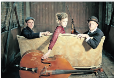
Die COUCHIES Berlin kommen nach Schwedt.

„In Echt?“ macht die Erzählungen Überlebender des Holocaust digital erlebbar und schafft neue Räume für Erinnerung und Dialog. Aus Rohdaten volumetrisch aufgezeichneter Interviews mit den letzten NS-Zeitzeuginnen und Zeitzeugen, die im Archiv der Filmuniversität Babelsberg Konrad Wolf vorliegen, wurde als gemeinsames Projekt eine Virtual Reality-Anwendung für eine Ausstellung entwickelt. Jugendlichen und Erwachsenen werden in Workshops neue Wege der Auseinandersetzung mit der NS-Zeit und der Begegnung mit NS-Zeitzeuginnen und Zeitzeugen eröffnet. Die Ausstellung analysiert und vermittelt, welche Potenziale und Grenzen die Möglichkeiten der virtuel-