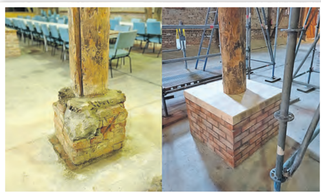
Eine Stütze in der Scheune Pinnow vor und nach der Sanierung.