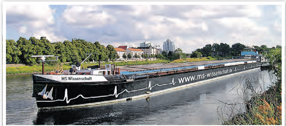
Retusche: Gabriel Kienast

An rund 30 Exponaten können Besucher im Bauch des ehemaligen Frachtschiffs selbst aktiv werden. Sie können zum Beispiel Medikamente an einem künstlichen Organ testen, ihren Herzschlag mit einer Kamera messen