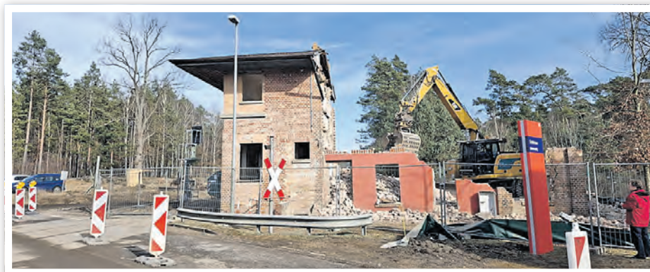
Rückbau des Stellwerks Schönow (März 2026)

» Am 23. Februar 2026 begann der Rückbau des alten Stellwerksgebäudes am Haltepunkt Schönow (Uckermark). Der Rückbau des Gebäudes war für den zweigleisigen Ausbau der Bahnstrecke Angermünde über Passow bis zur Grenze zu Polen notwendig. Bis 2026 wird die rund 49 Kilometer lange Gesamtstrecke modernisiert und durchgehend zweigleisig für Geschwindigkeiten bis 160 km/h ausgebaut. Auf der freiwerdenden Fläche in Schönow ist die Anlage von Parkplätzen und überdachten Fahrradabstellplätzen geplant.