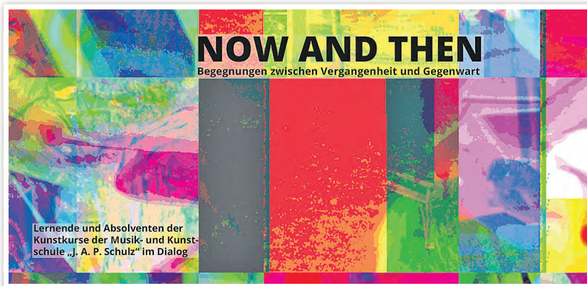
Einladungsflyer, Layout: Norbert Löhn

„NOW AND THEN“ ist eine Begegnung zwischen Vergangenheit und Gegenwart, die zeigt, wie sich künstlerische Laufbahnen entwickeln können und welche Rolle die Ausbildung an der Musik- und Kunstschule Schwedt dabei spielt. Die teilnehmenden Künstlerinnen