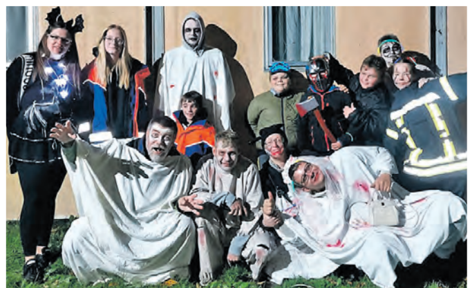
Ein gruseliger Empfang der Jugendfeuerwehr zur Halloween-Party.