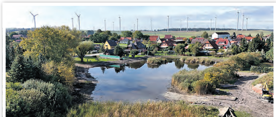
Der Teich mit seinen Schilfbereichen bietet verschiedenen Vögeln Nahrung, Verstecke und Brutplätze.

entnehmen können. Aus dem ILB-Förderprogramm „Naturnahe Gewässerentwicklung“ wurde die Maßnahme finanziert.