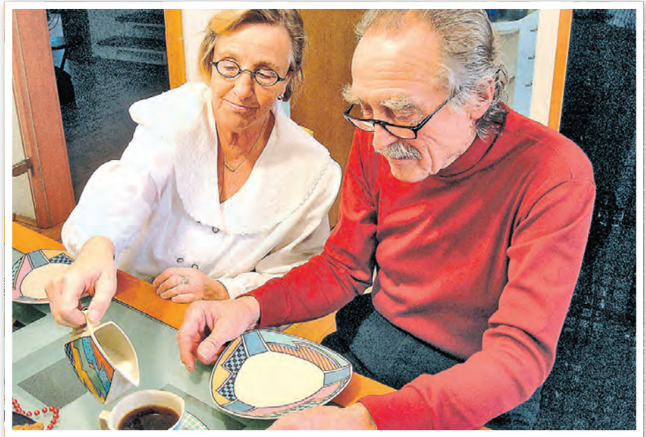
Die Pflege eines Angehörigen ist nicht immer leicht. Holen Sie sich Rat!

Kann es mich auch treffen? Über diese und viele weitere Fragen sprechen wir gemeinsam in kleiner Runde. Gute Aufklärung und Information kann Teil der frühzeitigen Erkennung sein.