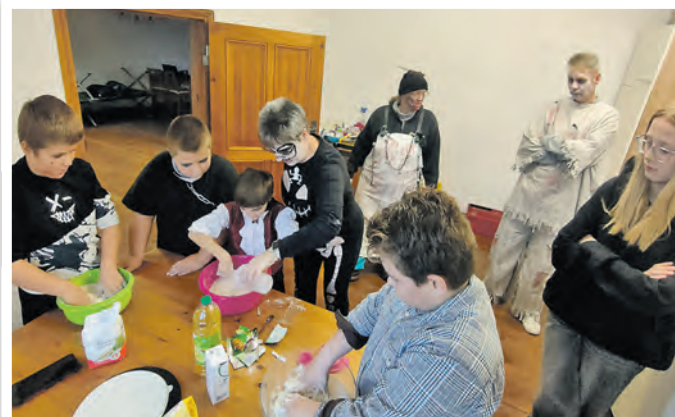
Die Jugendfeuerwehr ist auch in der Küche ein Team.

» Am 26. Oktober gab es bei der Jugendfeuerwehr Schönermark gruselige Freude bei den Teilnehmenden der Halloween-Party mit Übernachtung im Gerätehaus. Die Betreuer hatten das Gerätehaus schon entsprechend dem Thema der Party gruselig geschmückt und empfingen die Kinder zünftig gekleidet und passend gestylt.