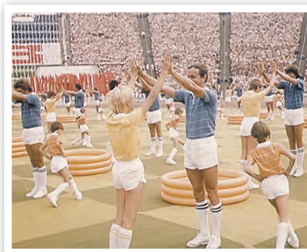
Filmausschnitt „Das Turn- und Sportfest in Leipzig 1983“