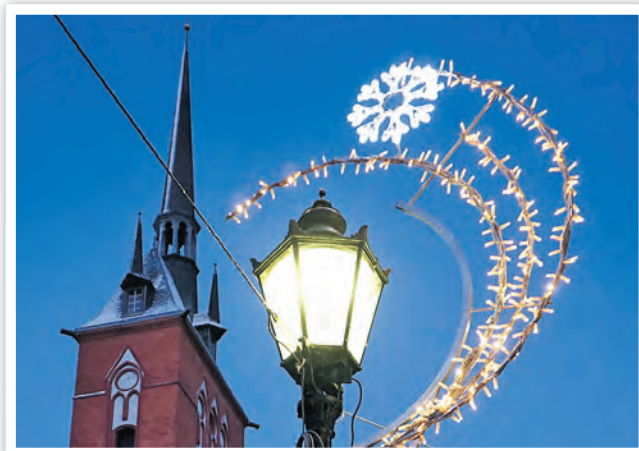
In der Adventszeit wird die Innenstadt weihnachtlich geschmückt.

Das Programm ist wieder vielfältig und die treuen Gäste werden sich an