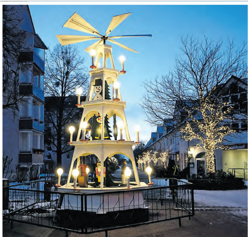
Die Weihnachtspyramide am Kirchplatz.