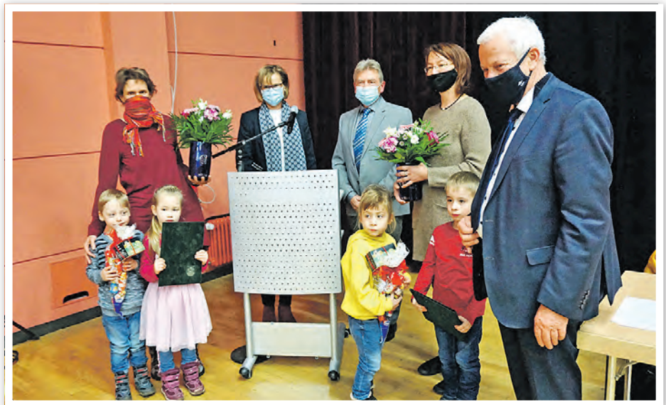
Verleihung des Umwelt- und Naturschutzpreises 2020 an den Integrativen „Naturkindergarten“ und des Sonderpreises an die Integrations-Kindertagesstätte „Regenbogen“.