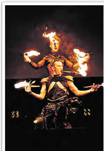
Die Flugträumer verzaubern mit einer Feuer-Show mehrere Festbereiche

Die „Flugträumer“ bringen den Hugenotenpark mit ihrer einzigartigen Feuer-Show in das richtige Licht.