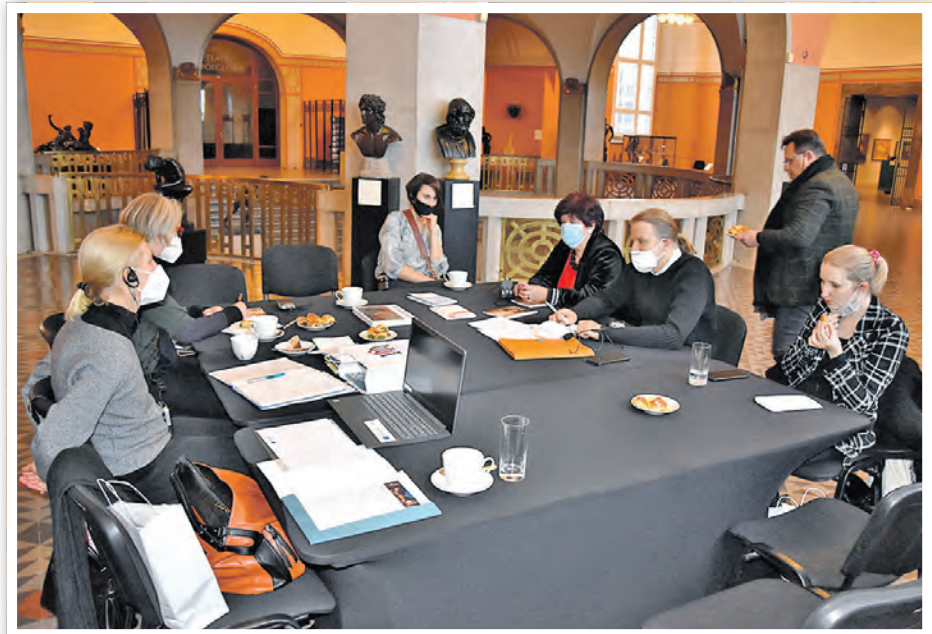
Deutsch-Polnisches Museumsnetzwerk: Konferenz im Nationalmuseum Szczecin im Dezember 2021

Die ersten Konferenzen im Netzwerk haben schon jetzt zahlreiche Anknüpfungspunkte auf deutscher und polnischer Seite hervorgebracht. Die ersten inhaltlichen Annäherungen zwischen den Museen zeigen, wie wichtig ein