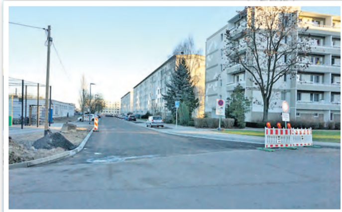
Stand der Rekonstruktion der Straße „Am Sportplatz“ im Januar 2022.

Hafenstraße begonnen, d. h. dem Ausbau der Fahrbahn und barrierefreier Umbau der Bushaltestellen. Außerdem soll in diesem Jahr die Ortsdurchfahrt Schöneberg erneuert werden. Neben der Ortsdurchfahrt werden auch die Gehwege erneuert. Kummerow erhält bis Neue Mühle einen neuen Radweg. Der Radweg zwischen Schwedt Friedhof und Vierraden, entlang der Vierradener Chaussee, der bisher noch aus Beton und Betonsteinpflaster besteht, wird komplett zurückgebaut und durch einen neuen Radweg in Asphaltbauweise ersetzt. Beim Heinersdorfer Damm, von der Karl-Teichmann-Straße bis Julian-Marchlewski-Ring, erfolgt eine Erneuerung der Decke sowie der Regenentwässerung. Zu guter Letzt soll am Ende dieses Jahres mit der Erschließung der Eigenheimsiedlung in der Felchower Straße begonnen werden.