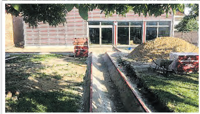
Das neue SEMINARhaus kurz vor der Fertigstellung im Juli 2021.