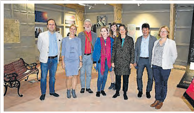
Die Interreg VA- Projektpartner aus Schwedt und Kulice bei der feierlichen Eröffnung des SEMINARhauses.