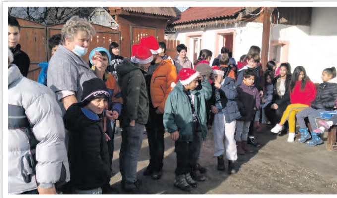
Die Kinder warteten schon gespannt auf die Päckchen aus Schwedt