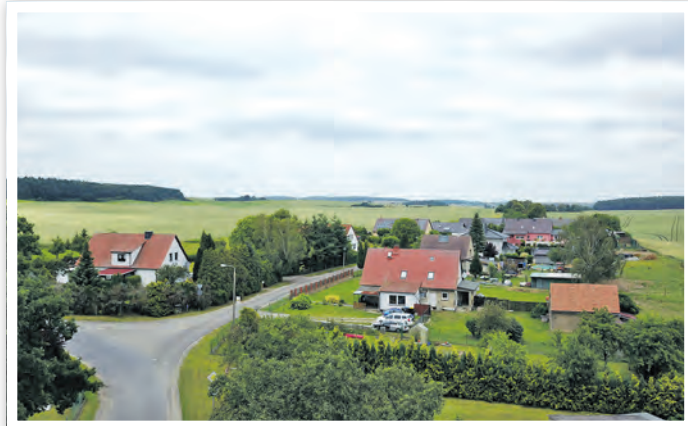
Zum Springsee, Abzweig Waldblick in Schöneberg.