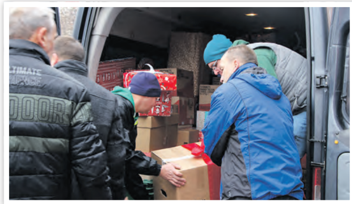
Der Transporter wurde mit den Weihnachtspäckchen beladen.