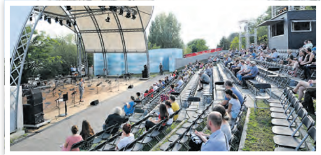
Odertal Bühne der Uckermärkischen Bühnen Schwedt