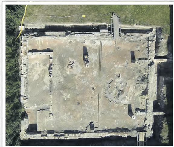
Das Synagogenfundament aus der Vogelperspektive