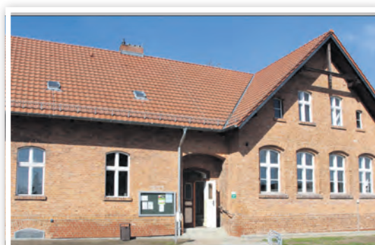
Gemeindehaus in Heinersdorf, April 2020