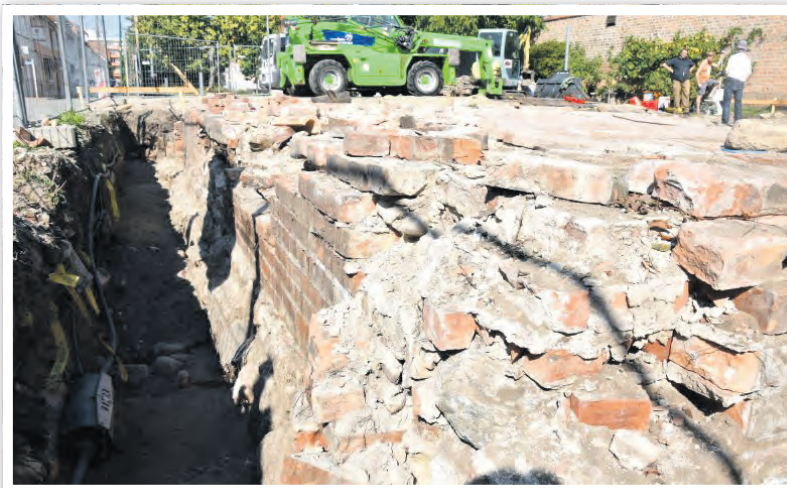
Baustart für die Überdachung des historischen Fundamentes

» Es gibt Neuigkeiten aus dem Jüdischen Museum in der Gartenstraße. Das Museum ist seit Oktober in der Winterpause, trotzdem herrscht hektisches Treiben rund um das Ritualbad: Die Bauarbeiten an der Überdachung des Bodendenkmals ehemalige Synagoge haben begonnen! Die Vermesser waren fleißig und auch die archäologischen Untersuchungen sind mittlerweile abgeschlossen. Das freigelegte Synagogenfundament wurde gesichert, die Baustelle ist eingezäunt und Schritt für