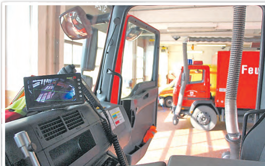
Bildschirm im Feuerwehrfahrzeug zeigt den rechten Fahrbereich im toten Winkel