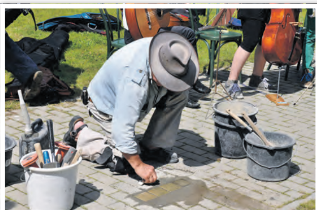
Verlegung von Stolpersteinen für Familie Seelig in Schwedt/Oder

RKVA Eberswalde IBAN: DE39 5206 0410 0203 9017 42 Verwendung: Stolpersteine Schwedt