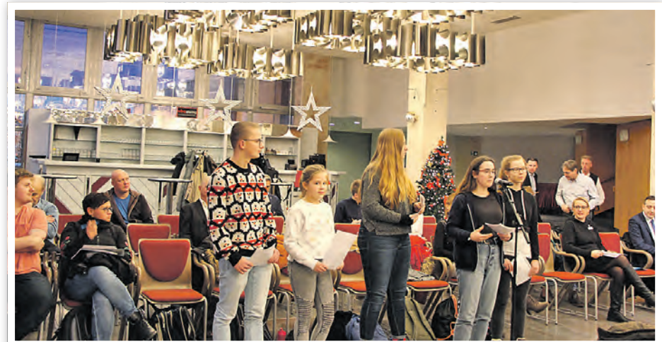
Kinder- und Jugendrat bei der SVV am 5. Dezember 2019

AUFRUF DES SCHWEDTER KINDER- UND JUGENDRATES