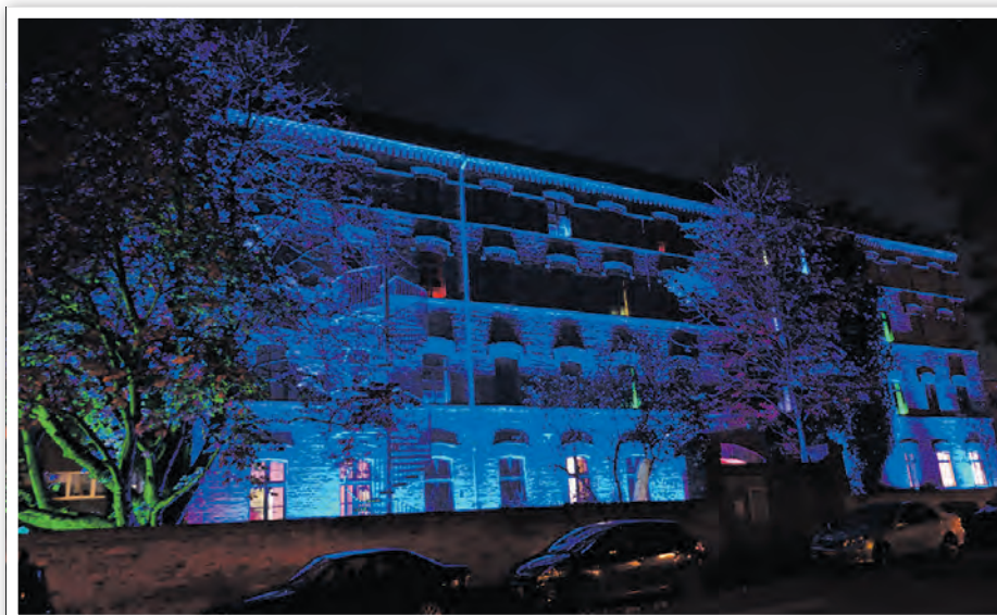
Der von Dietmar Korth beleuchtete Gerberspeicher