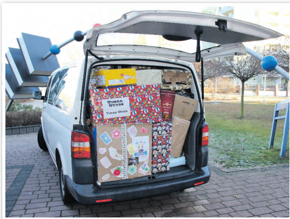
Vorbereitungen für die Fahrt nach Ocland 2018