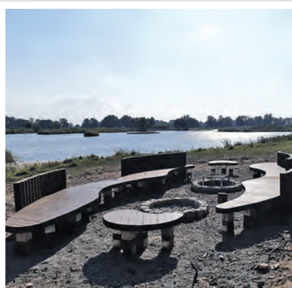
Naturrastplatz Boleszkowice Chlewice