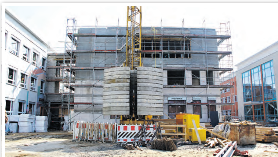
Baufortschritt an der Aula der Grundschule „Astrid Lindgren“ am 27. März 2020