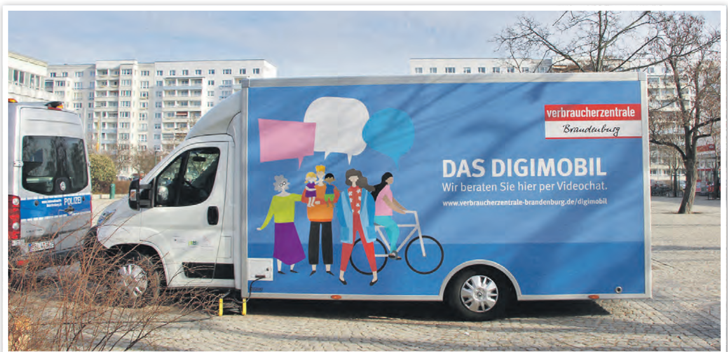
Das Digimobil kommt bis auf Weiteres nicht.

Dort gibt es täglich aktualisierte Hilfe zur Selbsthilfe beim Umgang mit den Folgen der Corona-Pandemie. Zudem bietet die Beschwerde-Box die Möglichkeit, unkompliziert Fälle von „Corona-Abzocke“ zu melden.