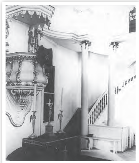
Die Schlosskapelle wurde unter Friedrich Wilhelm erbaut

Gleichzeitig war der Markgraf originell, häufig witzig und auf seine Weise populär: Während er viel Energie darauf verwandte, ehrbare Bürger, kleine Landjunker, Pfarrer und Beamte in seiner Umgebung zu schikanieren, konnte er gegenüber den „einfachen Leuten“ ein fürsorglicher Patriarch sein, der bei Krankheiten persönlich mit der Medizin in den Katen erschien und