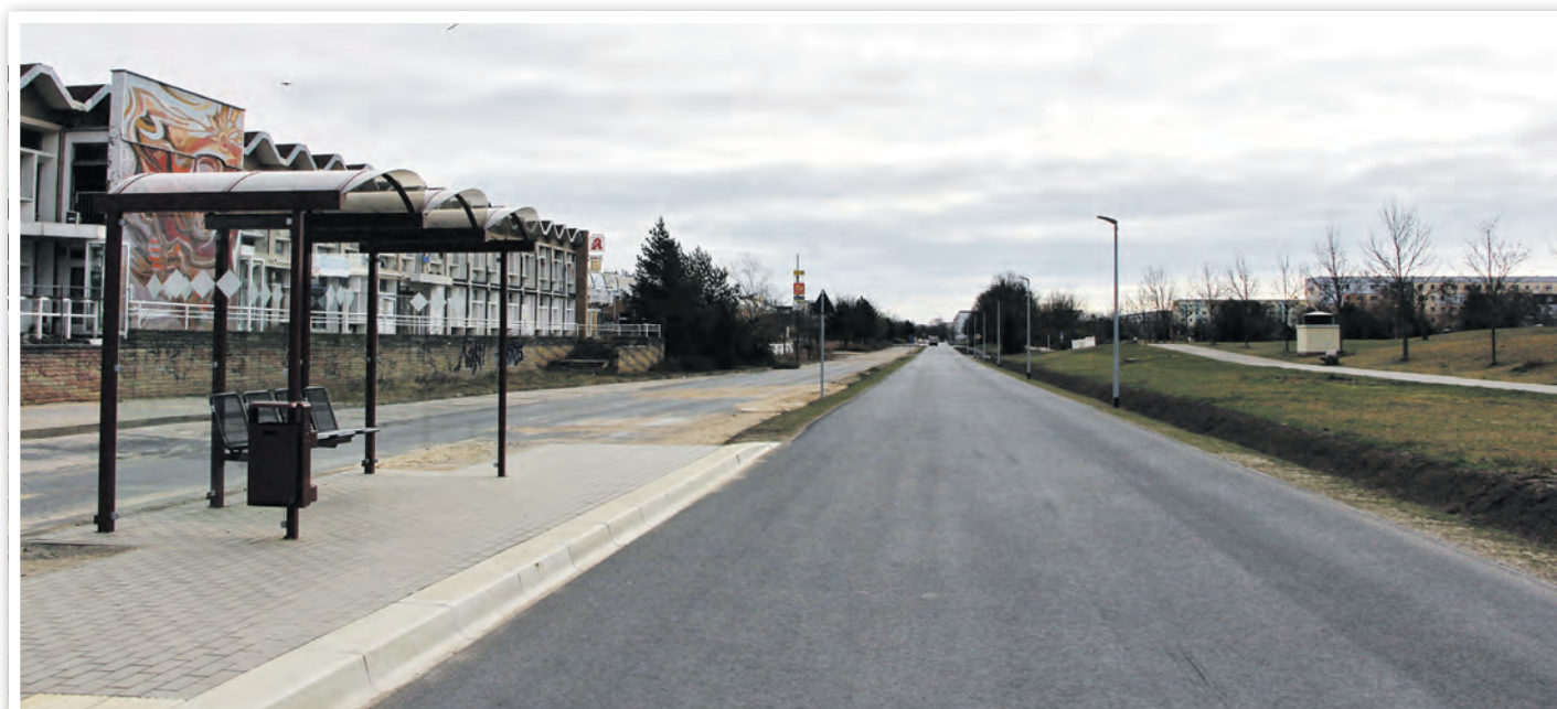
Friedrich-Engels-Straße, 1. April 2020, es fehlt nur noch die Fahrbahnmarkierung, die inzwischen erfolgt ist