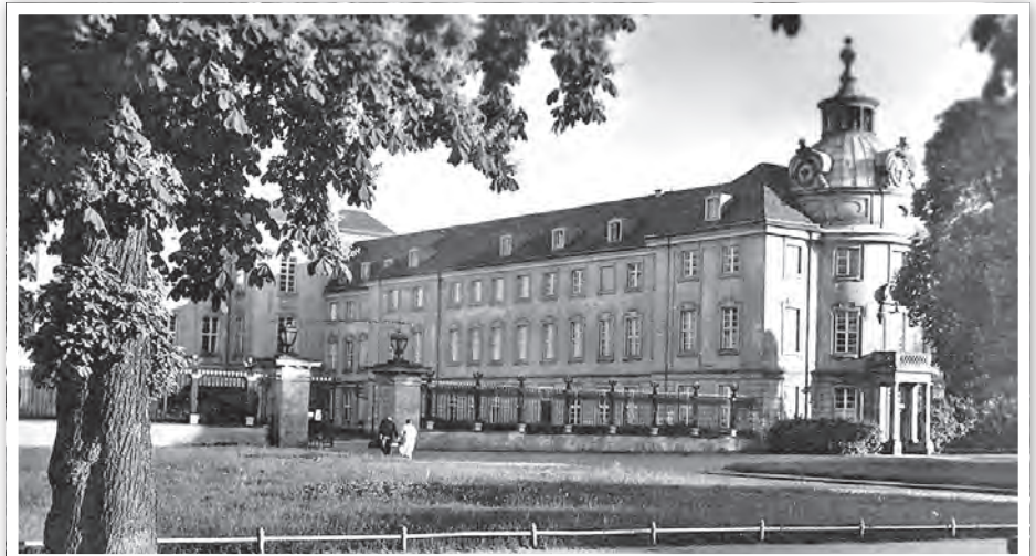
Den „neuen Flügel“ ließ Friedrich Wilhelm in seinen frühen Regierungsjahren vollenden, Postkarte