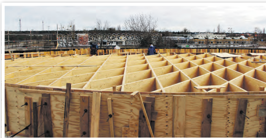
Dachkonstruktion an der Aula der Grundschule „Am Waldrand“ am 1. April 2020

Alte Fabrik, Raum 117, Dr.-Theodor-Neubauer-Str. 12 Fachbereich 4, Herr Ziesche ☎ 03332 446-213 ✉ tiefbauamt.stadt@schwedt.de www.schwedt.eu