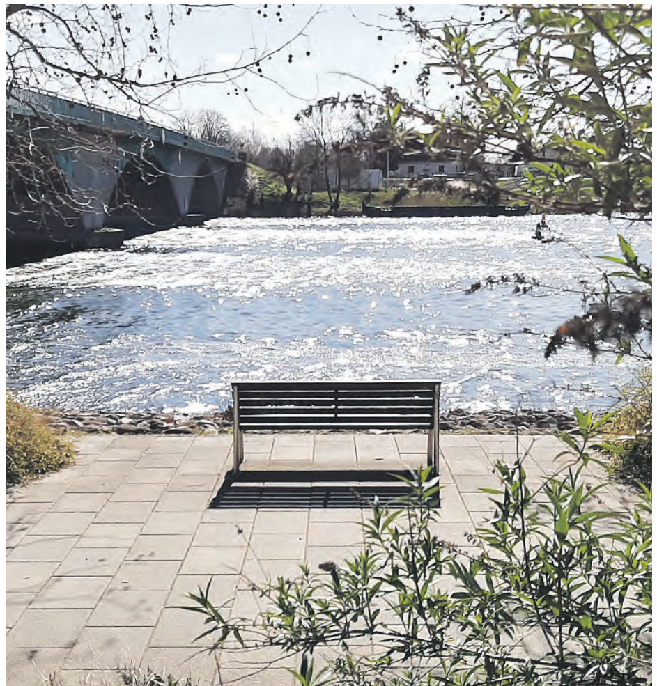
Uferweg Schwedt/Oder, März 2020

» Wir möchten an der Stelle darauf aufmerksam machen, dass die hier im Journal veröffentlichten Informationen bei Erscheinen des Blattes vielleicht nicht mehr aktuell sind. Wegen der aktuell gegebenen Situation durch Corona, in Verbindung mit einer langen Produktionszeit, können wir nicht kurzfristig genug reagieren. Inhaltlich sind wir abhängig von den Entscheidungen der Landesregierung und des Land-