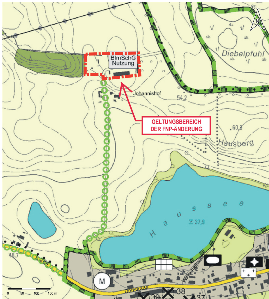
Auszug aus der Planzeichnung zum wirksamen Flächennutzungsplan mit Kennzeichnung des Geltungsbereiches der geplanten FNP-Änderung (rote Markierung/unmaßstäblich)