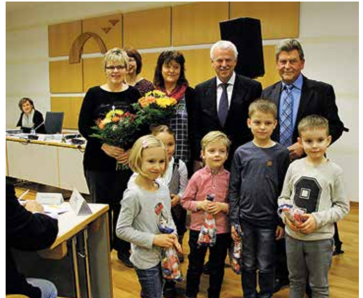
Preisträger 2016 war der Integrative Naturkindergarten mit dem Projekt „Unsere Entenfamilie im Naturkindergarten“

Einsendeschluss im Büro des Bürgermeisters ist der 31. Oktober 2018. Der Preis wird im Rahmen der öffentlichen Stadtverordnetenversammlung am 6. Dezember 2018 verliehen.