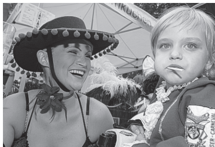
Alt und Jung feiern beim Landesfest

Neujahrsempfangs des Bürgermeisters im Hause der Uckermärkischen Bühnen Schwedt. „Ich bin überzeugt, es wird erlebbar, dass Schwedt nicht irgendwo am Rande, sondern mittendrin in einer zukunftsträchtigen Region liegt.“