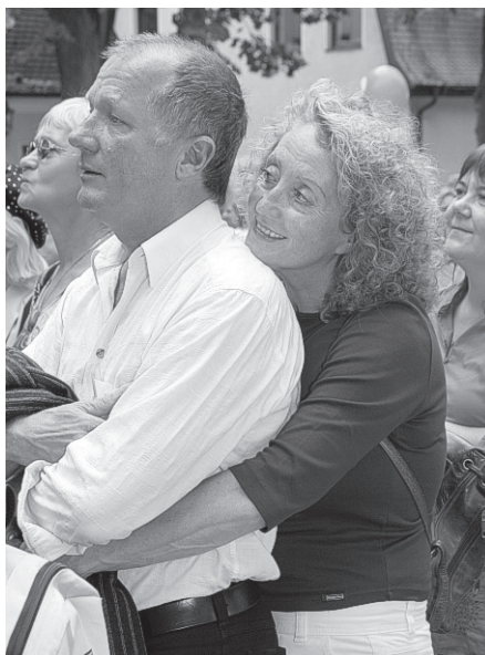
Alle sind recht herzlich eingeladen zum „Rendezvous in Schwedt ...“

der. Hier an der Oder finden die landschaftlichen Reize der Mark Brandenburg und die wirtschaftliche Dynamik der deutsch-polnischen Grenzregion zu einer gelungenen Symbiose. „Dies werden wir in vier Festbereichen zeigen, wobei die gesamte Stadt von der Oder über den Hugenottenpark rund um das Theatergebäude,