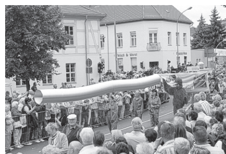
... Adler trifft Pipeline!“

Im Festbereich D werden Gesundheits-, Handwerker- und Kunstmärkte die Altstadt rund um die evangelische und katholische Kirche bis hin zum Stadtpark in eine große Flaniermeile verwandeln. Gewerbetreibende präsentieren ihre Angebote in der historischen Altstadt. Durch die Stadt Schwedt/Oder wird das einzig erhaltene und wieder rekonstruierte jüdische Ritualbad in Brandenburg, die Mikwe in der Gartenstraße, als Ausstellungsort offiziell eingeweiht, das Stadtmuseum eröffnet eine Sonderausstellung zum jüdischen Leben, die Galerie am Kietz lädt zum Hoffest ein.