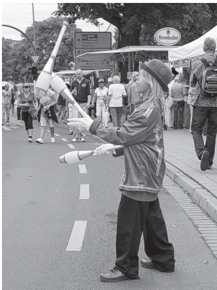
Kleine Künstler kommen ganz groß raus auf dem BRANDENBUR-TAG.

Auch wenn sich der Schnee gerade meterhoch auf den Straßen und Plätzen von Schwedt türmt und die Oder vor den Toren der Stadt vom Eise umschlungen ist: In der uckermärkischen Industrie-, Theater- und Nationalparkstadt ist dennoch schon weit mehr als anderswo im Lande ein Hauch von Sommer an allen Ecken und Enden zu spüren. Schwedt/Oder wird am 4. und 5. September dieses Jahres Gastgeberstadt des großen Landesfestes der Brandenburgerinnen und Brandenburger, des mittlerweile 12. BRANDENBUR-TAGes, sein. Seit dem Jahresbeginn und spätestens seit dem Besuch von Ministerpräsident Matthias Platzeck Ende Januar beim Neujahrsempfang des Bürgermeisters Jürgen Polzehl sind Schwedt/Oder und die Region des unteren Odertals in die heiße Phase der Vorbereitungen eingetreten.