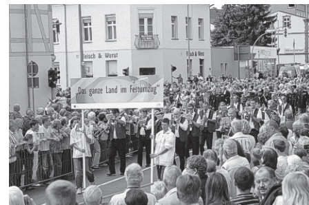
„Das ganze Land im Festumzug“ beim BRANDENBUR-TAG 2008

Auf Geheiß von Dorothea von Holstein-Glücksburg, der zweiten Frau des Großen Kurfürsten