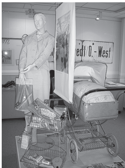
Das Kostüm aus den 70ern ist ebenfalls eine Schenkung. Die Besitzerin trug es zur Hochzeit ihrer Tochter.

Das Stadtarchiv präsentiert historische Archivalien.