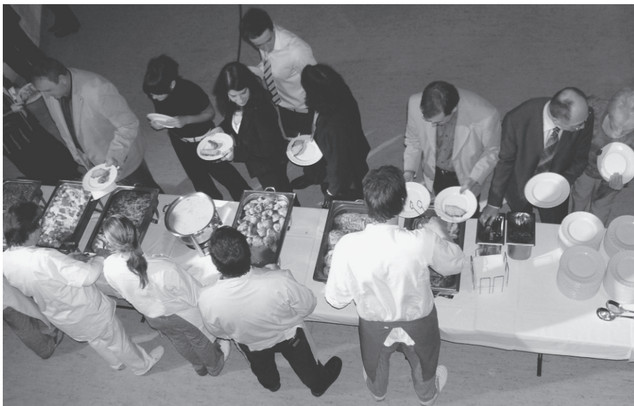
Für das leibliche Wohl wird auch wieder gesorgt.

zeitung kürt an diesem Abend auch die populärsten Sportler, Sportlerinnen und Mannschaften in Auswertung der Sportlerumfrage. Umrahmt werden die Ehrungen von einem sportlichen Showprogramm, Musik und Tanz.