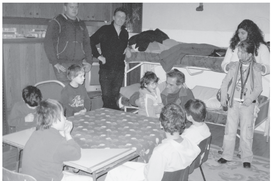
In einem Gruppenraum des Kinderheimes