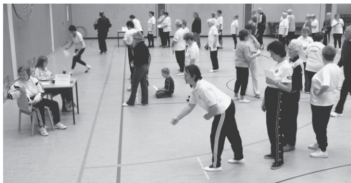
Seniorensportfest in der Sporthalle „Neue Zeit“ (Archivfoto 2006)