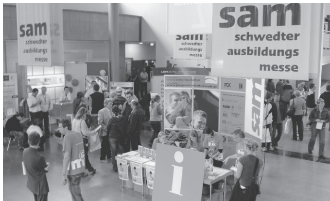
Schwedter Ausbildungsmesse 2007