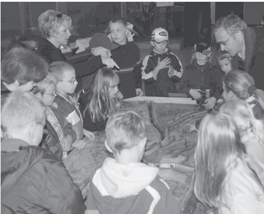
Erläuterung des Flutungssystems am Poldermodell