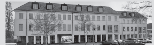
Außenstelle , Dr.-Th.-Neubauer-Straße 24

Postanschrift: Stadt Schwedt/Oder Dr.-Th.-Neubauer-Str. 5 16303 Schwedt/Oder